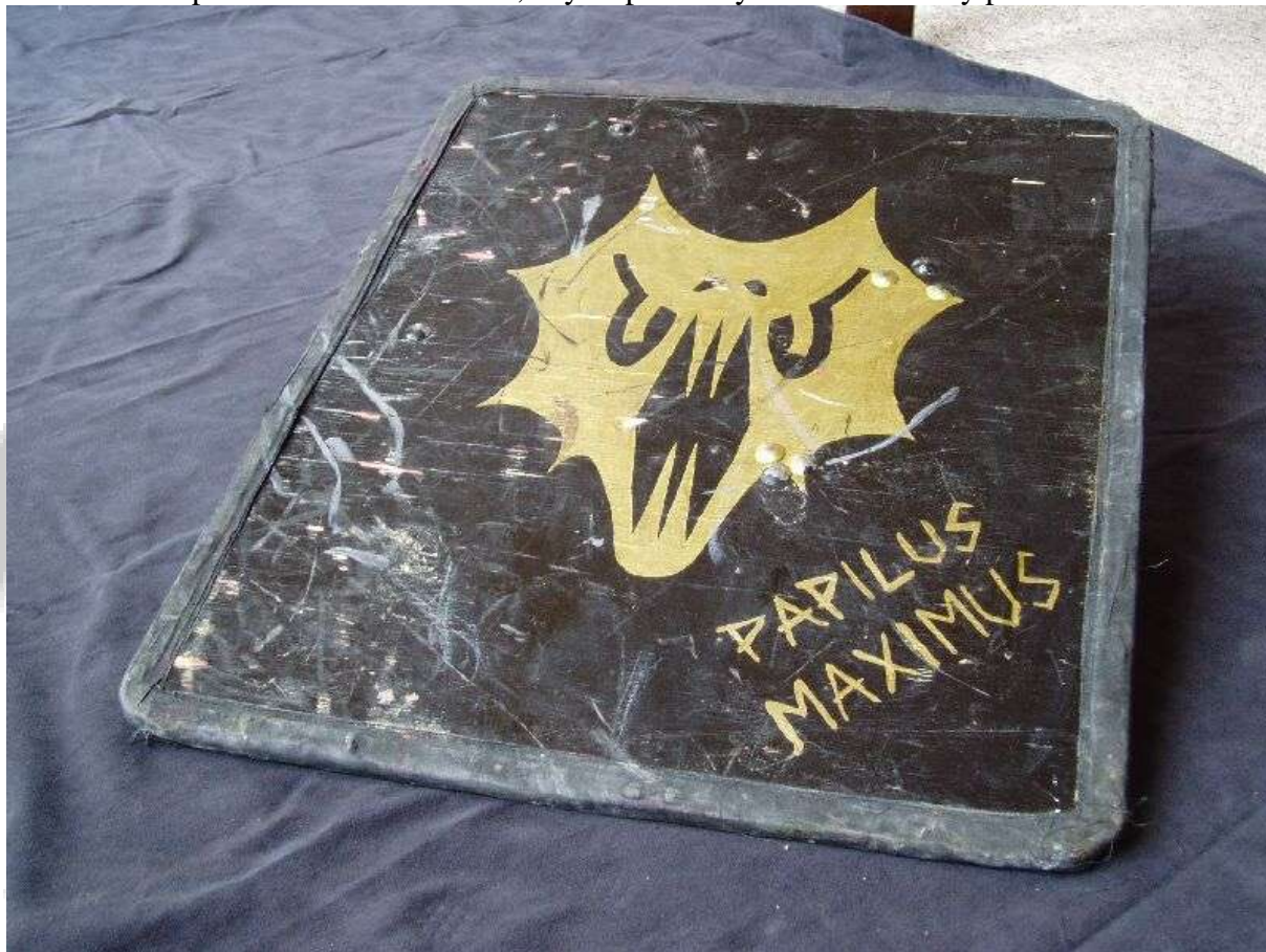
Štít po čtyřech letech – stále plně funkční i bez výraznější údržby!

Nekupujte překližku z materiálů jedle či smrk, i když by se oháněli visačkou vlhkuvzdorná atp. – smrk i jedle jsou sami o sobě příliš měkká dřeva na to, aby se překližky čistě z nich daly použít na štít.